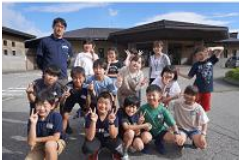
⑧自然の家到着（３）４年生のみ