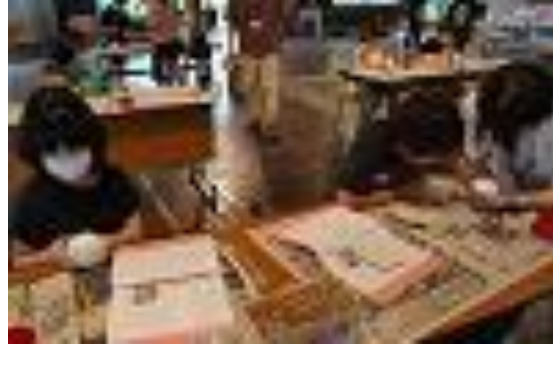
⑰フクロウの絵付け（２）