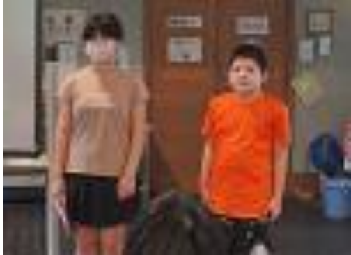
⑯フクロウの絵付け（１）・代表