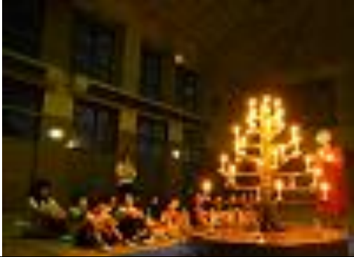
⑬キャンドルファイヤー（１）