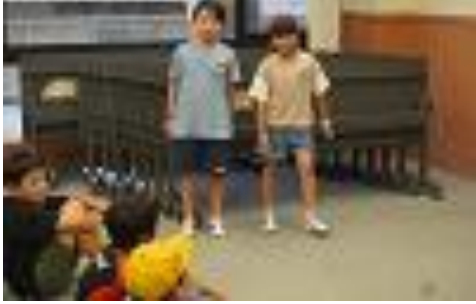
⑩館内オリエンテーリング（１）・代表